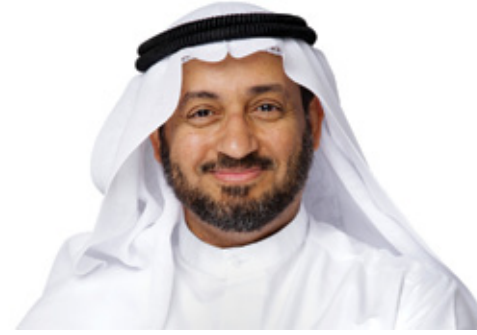
الدكتور موسى الجويسر الخبير الدولي في علم أنماط الشخصية